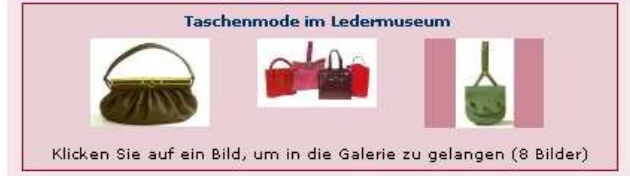
Klicken Sie auf ein Bild, um in die Galerie zu gelangen (8 Bilder)

Um möglichst viele Teile des Angebots auskosten zu können, wurden die Kulturinteressierten von Shuttle-Bussen oder Fahrradtaxi durch die Städte kutschert. Ein Shuttle-Schiff bot sogar die Möglichkeit, über den Main zu neuen kulturellen Zielen aufzubrechen.