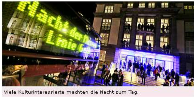
Viele Kulturinteressierte machten die Nacht zum Tag.