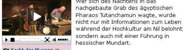
Nacht der Museen in Frankfurt und Offenbach 4:27 Min

Im Ledermuseum in Offenbach konnten Besucher kuriose und skurrile Schuhe und Handtaschen aus sechs Jahrtausenden und von allen Kontinenten bewundern. Passend dazu gab es zur Nacht der Museen eine Sonderausstellung mit ausgefallenen Fächern.