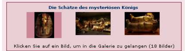
Klicken Sie auf ein Bild, um in die Galerie zu gelangen (18 Bilder)

Im Ledermuseum in Offenbach konnten Besucher kuriose und skurrile Schuhe und Handtaschen aus sechs Jahrtausenden und von allen Kontinenten bewundern. Passend dazu gab es zur Nacht der Museen eine Sonderausstellung mit ausgefallenen Fächern.