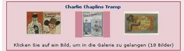
Klicken Sie auf ein Bild, um in die Galerie zu gelangen (18 Bilder)

Publikumsfavorite war der Erweiterungsbau des Städelmuseums. Zahlreiche Besucher strömten auch in die Chaplin-Ausstellung im Deutschen Filmmuseum. Unter dem Titel "Charlie, the Bestseller" konnte man sich dort vor einem Bluescreen in einer Charlie Chaplin-Szene filmen lassen.