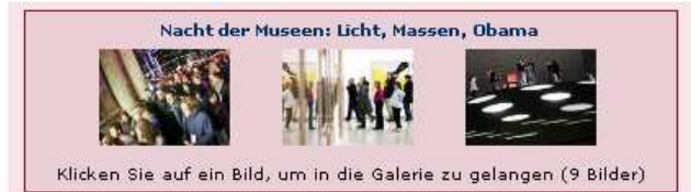
Klicken Sie auf ein Bild, um in die Galerie zu gelangen (9 Bilder)

Insgesamt 48 Museen beteiligten sich an der 13. Auflage der Kulturveranstaltung in der Nacht von Samstag auf Sonntag. Neben alten Bekannten wie dem Senckenberg Museum oder dem Ledermuseum waren auch neue Ausstellungsorte dabei: Erstmals beteiligten sich etwa der Jazzkeller oder der Börsenverein des Buchhandels am nächtlichen Kulturtreiben.